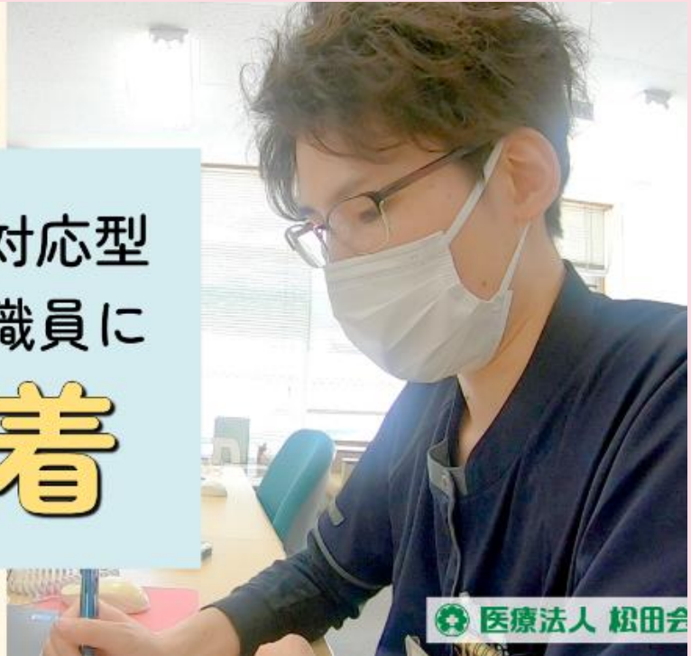
ホームケアステーション八木山24職員密着動画