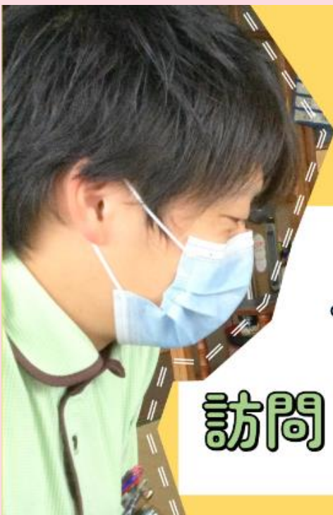
アルパイン川崎訪問リハビリテーション紹介動画