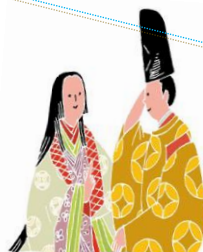
イラスト/川口優子